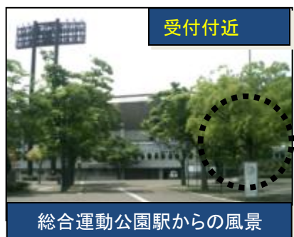
総合運動公園駅からの風景